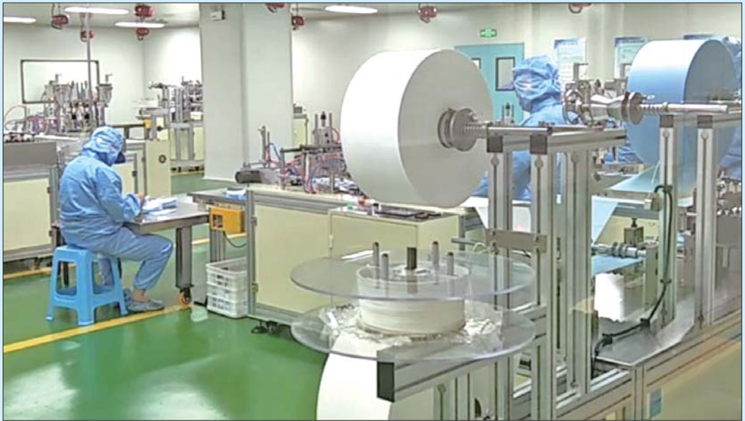
这些“英雄的生产线”在抗疫紧要关头日夜奋战,起到了关键作用,如今进入休养阶段。