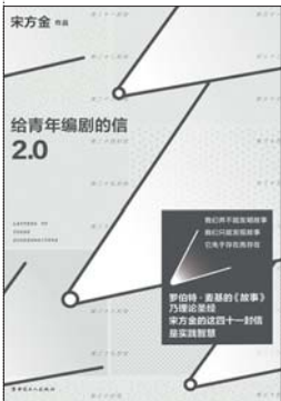
《给青年编剧的信2.0》 宋方金 著 工人出版社

宋方金引用过麦基在《故事》中写到的一个观点,“故事是生活的比喻”,他本身也是一位喜欢比喻的编剧与演讲者,在诸多演讲中,宋方金喜欢在结尾时以诗朗诵的形式,来传达他对剧作(生活)的观点,而往往这些诗朗诵,会给听众留下深刻的印象,由此可以推断,把生活里的诗意往作品中灌注,并倡导一种积极昂扬的生活态度,算是宋方金主要的创作价值观之一。 “情真意切,情深谊长”并非《给青年编剧的信2.0》的主要风格,如果想要寻找一个关键词来形容本书,“鞭策”可能更合适些。四十一封信,四十一个章节,统一的指向都在引导着青年编剧们走出书斋,去发现社会,见识业界,识别谎言,寻求真谛,按诉求主次来区分,《给青年编剧的信2.0》提供了这三个层面的进阶方法:先要当一名不容易被蒙蔽的编剧,其次是成为