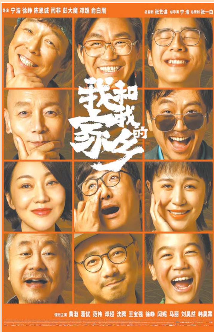
国庆档电影《我和我的家乡》海报中出现了六位“百亿演员”