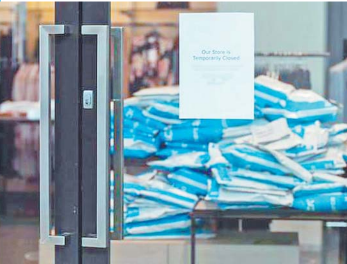
疫情下澳大利亚部分代购店停业。(资料片)

除零售业外,旅游和留学产业也正是澳大利亚此次疫情期间受创最严重的产业。 旅游业方面,澳大利亚统计局数据显示,在2019年7月至2020年6月的财政年度里,海外短期访客人数比上财年下降27.9%,创下6年来新低。其国内旅游业仅在4月和5月里就遭受了117亿澳元的打击。 TRA(澳大利亚旅游研究)的建模预计,2020/2021财年该国旅游业的损失额将达到550亿澳元(约合人民币2673亿元)。 留学业方面,维多利亚大学智库米歇尔学院的一份研究报告指出,国际留学生对于澳大利亚经济从疫情中复苏至关重要,国际留学生每年为其经济贡献380亿澳元(约合1840亿元人民币),支撑了超过13万个就业岗位。但由于国际学生数量锐减,尤其中国学生,该国国际教育产业面临着巨大亏损的风险。 据澳媒报道,5月份该国留学生申请数量已经暴跌了88%,这直接导致澳大利亚的高校收入大幅缩水,甚至有高校已经开始卖楼求生,例如皇家墨尔本理工大学和斯威本科技大学分别于6月和7月宣布出售在墨尔本市区的产业。 悉尼大学预计,未来四年学费总收入将损失5.5亿澳元以上,并预测疫情对收入的影响将持续到2025年。悉尼大学校长宣布,包括他本人在内的学校管理层将降薪20%。此外,新南威尔士大学、莫纳什大学、墨尔本大学等多所澳高校都分别宣布数百人的裁员计划。澳大利亚大学联盟预测,明年高校还将失去2.1万个工作岗位。 据央视