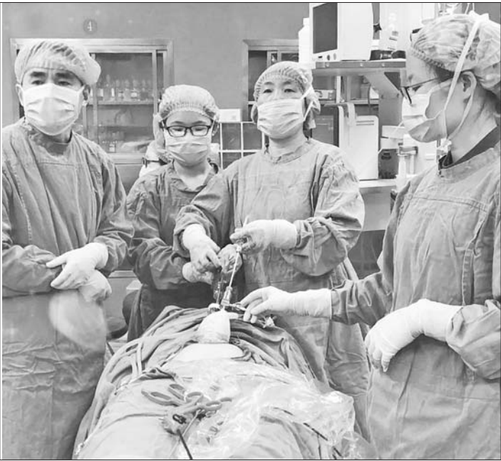
手术中,医护人员沉着冷静克服种种不利因素。

本报4月11日讯(记者 支倩倩 通讯员 韩秀芝) 近日,章丘区妇幼保健院收住一位25岁患有卵巢肿瘤的年轻女患者。身材窈窕爱美的她,面对手术非常焦虑和担心:肚子上会不会留疤?留疤了怎么办?有没有更好的方法不留疤?